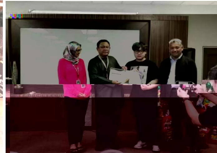
Certificate of Completion Grant