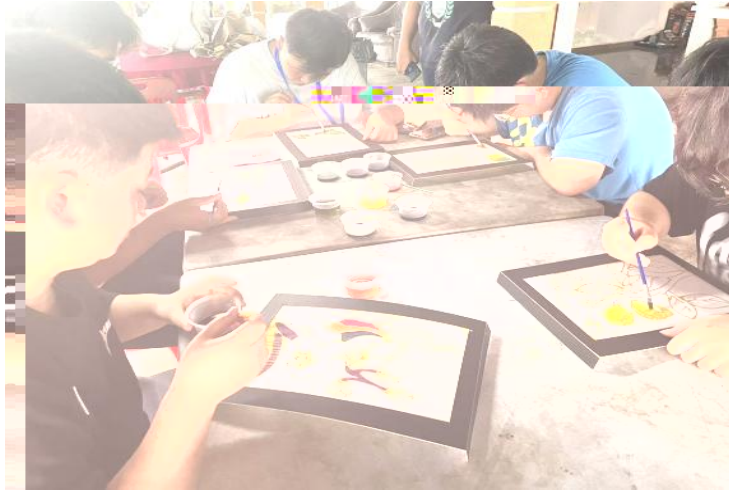
Experience Wax Painting&Drawing