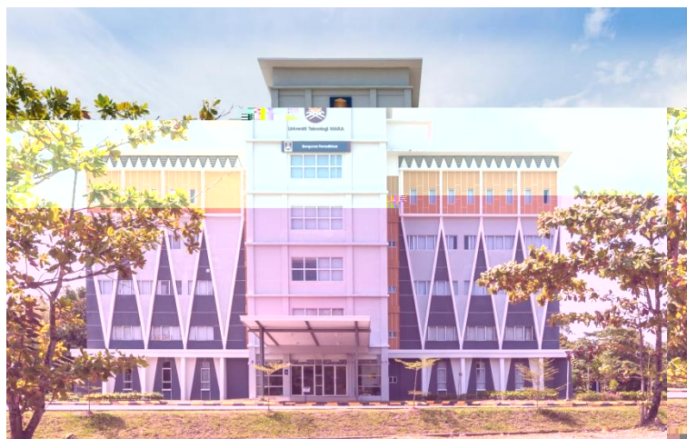
Administration Building / Rectorate