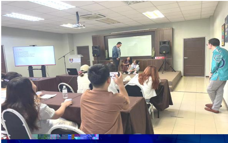
English Enrichment Course Class